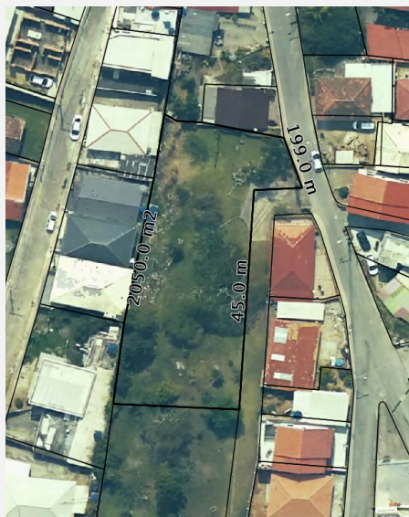
IMAGEM DO IMÓVEL